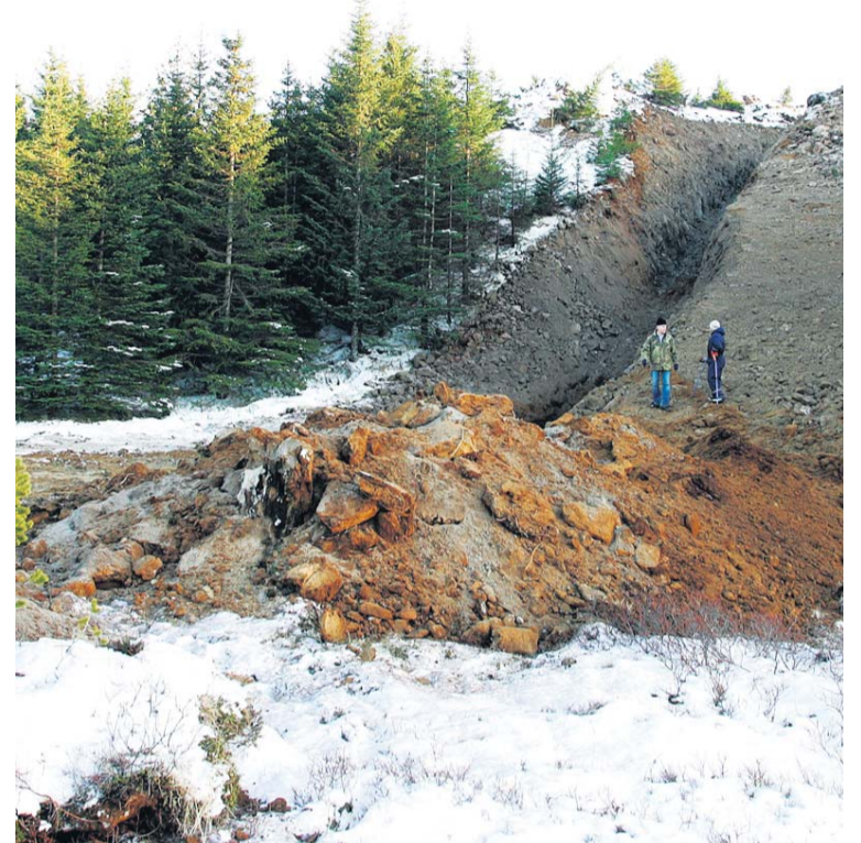
JARÐRASKIÐ Í HEIÐMÖRK Fulltrúar Skógræktarfélagssins og náttúruverndarsamtaka töluðu um að tuttugu ára vinna væri unnin fyrir gýg.